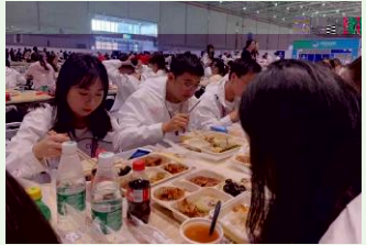
ij): kkl gmno