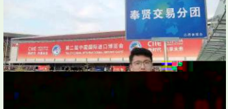
deEf" # $ % & gh]