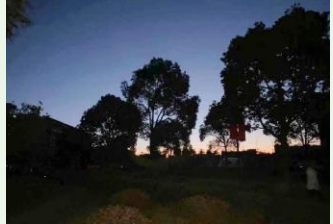
9gp* qrstuvwx y