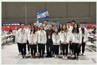
RSTUVWX*YZ[ \ ]