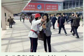
" # $ % & ^ _ ` H' abc