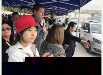
CDEF GHI J KLMNOPQ