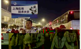
! 5:00 # $ % & ( ) * + , - . /