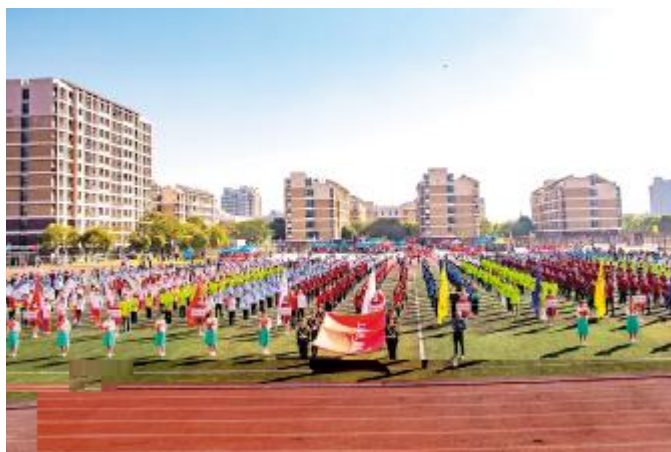
图为开幕式现场 孙庆华 / /

! " # $ % & ' ( ) ! 678m ) ! & 挥 &全 < & " s C 3 - TUV在 ) | O致辞-他表示& * 中D* &D - & O4;有 &才O4; 好&更O 4 希望全 O4人 : { | ms W终 >C 识&为8R H 献ON为 C - \ 打 MY ) | Cms - ; @. ) | -