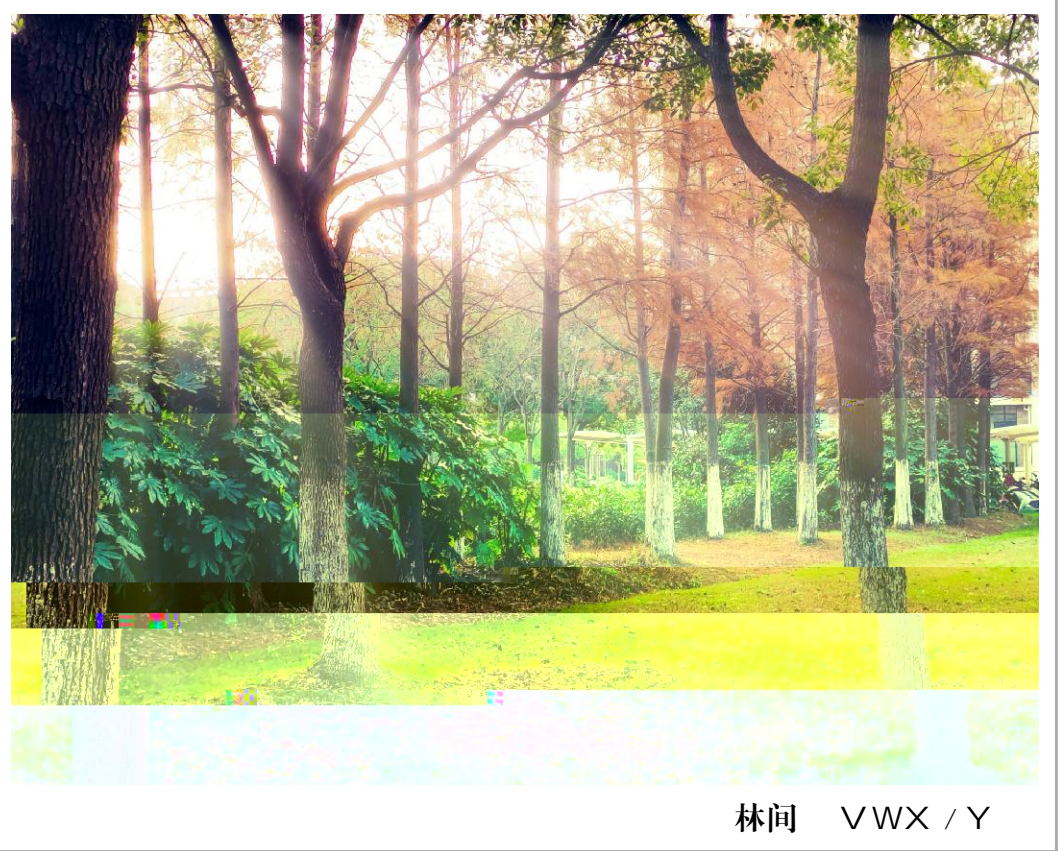
林间 VWX / Y

[ / 以 ] "Ey昔! 桀骜 s 羁] 身傲骨[ 天才文豪跌 坛"沦为戴 镣铐 街[ ( 囚"Ey 暗1天! [ ! t 妄 O/ 颓萎j 索eX) 瑟瑟X " / r 葬4 "c到 4r \ j m 勃勃[ 力H I J s E [ " Q 4" * 能j 发"* 能溢mj } H / 千 Oc O s " g! n J 掉Oo "c ! ! 山j "依 振 V帆"扬mc 盎 X H ^ [ b X. * 4I 1H = / S " / 善" / X达" / ] I " // 怀o 悯" / \ 苍j " / 有 [ 灵魂Rs 羁[ 傲 " / z 堂# 青苗 舌战G儒s " / 同佛印拌嘴屡败屡战s 罢休H =y / [ O"仿佛隔了千q