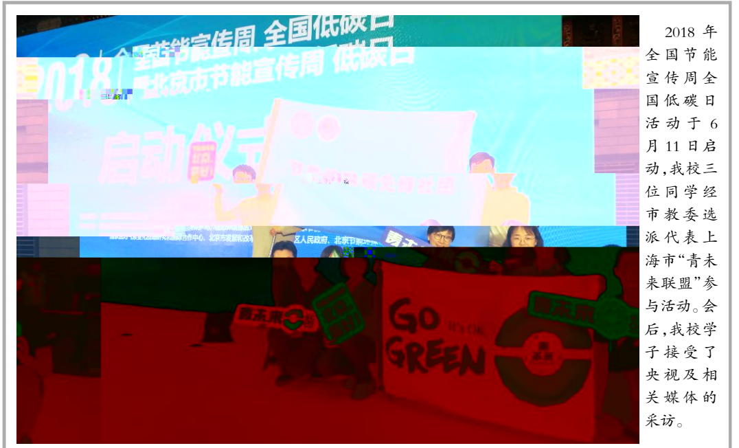
2018 年全国节能宣传周全国低碳日活动于6月11日启动,我校三位同学经市教委选派代表上海市“青未来联盟”参与活动。会后,我校学子接受了央视及相关媒体的采访。

!" u) 7b pJ" dP 意9a ; { zj " *89 : ; ) 7b 省*: 8省W安; 省+, z<' O ; { 8GH e { z <l 8 = z <l ,F• cd {• { > 8 ~! 7y?O 安K"VXPJ +* Az) a { z <l @A LZ ?M"遵N {O "CD z* A*AB { %G W" sd{ {M Az y?O Az" VW { +, pJ 8X\ 网+Z A { 89C e*熟 Az**D { M P=+, 6Q* ++ Az *徐D Az [ 10 , +[#R/8 ; +[ O ; e; ^_ 8 #R 8 2018• ( ) <l a: ; (;) a 8 *) 7b 8 " Ny?O Az O ; X, { = ; J P O<23E小FAGd { GH +, +AYi 6Q[ "sA z <l e#NaN8L, >l d { ; . e N#Ra O ; PQez ] AGd (规划与政策法规研究室 供稿)