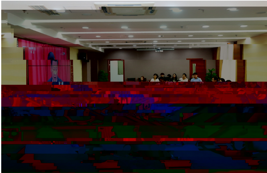
我校师生在报告厅内收看党的十九大开幕式盛况。

本报讯 10月18日，我校师生齐聚一堂，共同观看了党的十九大开幕式盛况。会场气氛庄重热烈，大家纷纷表示，要认真学习领会十九大精神，为学校的建设和发展贡献自己的力量。