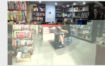
' @ b M c C 0 % 陈 f 自 r _ / 大 / 等

O 1 , - [ \ ] ^ _ % 天 不 ; 席 P O 期 f A O 业 们 在 N 天; ! A I : 在 N q 和 8 F N N s 装 w 装 在 I u O % Q 自 I 自 本 期 报 A 陆 续 出 O 业 , 以 1 们 O 业 I 们 . / O 1 2 3 4 5 6 7 8 ( 9: ; < =