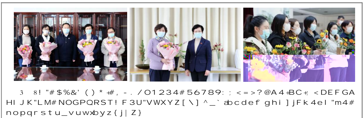
3 8! "# $ % & ' ( ) * + , - . / 0 1 2 3 4 # 5 6 7 8 9 : ; < = > ? @ A 4 + BC # < DEF GA HI JK " LM # NOGPQRST! F 3 U " VWXYZ [ \ ] ^ _ ` abcdef ghi ] j Fk 4 e l " m 4 # nopqrstu_vwxyz { | } Z

学校 专业建设, 进一步 强化专业建设 与 成 路、人工 能和生 性 业精准 推专业 业、 意 强、 成 , 实现 发展和 群发 展, 点建设 能 、 能建 、 、 专 业群, 行业 业 人 业体 中的 进 和 的 求。 ~ A