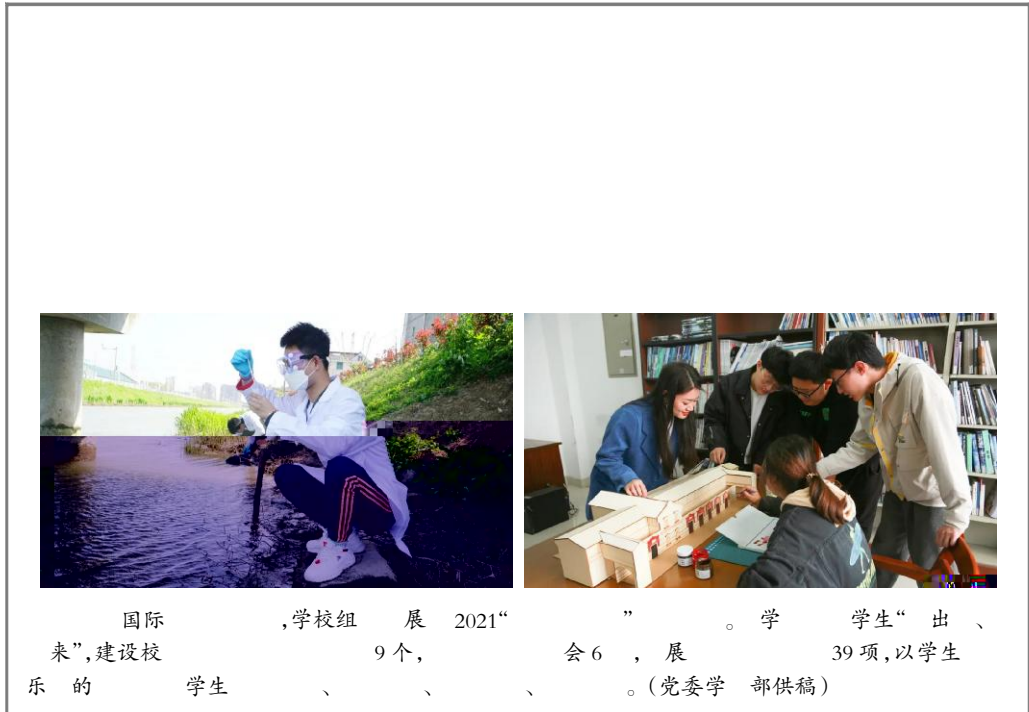
国际 ,学校组 展 2021“ ” 。学 学生“ 出 、 来”,建设校 9个, 会6 , 展 39项,以学生 乐的 学生 、 、 、 。(党委学 部供稿)

y&走活M是 yH 文4l 的一项活M,“KK党 D y&9 征 ”b主 i。活M期] 主方推^ 100 党 ,希望广 教职工 从党 中_ 奋进的 9 ,从 走中 y ` ,~ a 的精神Wbc 建党百W。 (校 会供稿)