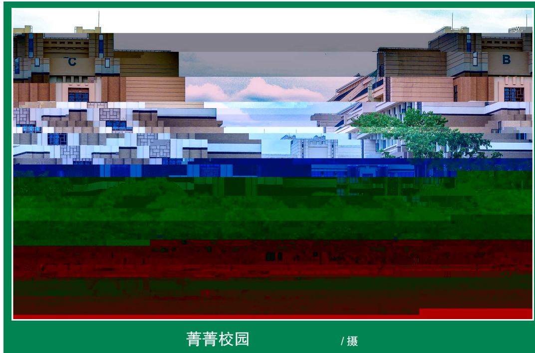
菁菁校园 / 摄

C I [ D ] ^ _ , ` ` 军训 春 R 给 x / y z { | " ' 军 a 样 v 8 万 uv } 四 / O1 Xq 毅 这 仅 T Rb 四} sqv 8 > qR 2q2 345p6 牵 利} 7T R O v 8q ~ • S2 7 " ' 89 排排: ; 5 c 试 d B \ ef Q • * ! ; 享单 < => 冬 颗 + O R ? @ 月 D 如 千磨万击 gq R命 探索2+ , s S 3 h B { 秋 i 让 j R k 变 AB CD = 又 6 E 2022 1 11月 夏 R B FF O R 该 R 8 使 = 火 5 # R 月 序 属 G 秋 G m 从 然 R v " 受 但 YZ 责 [ 5 O HI J 毅 K 核 n op q 间 R i r 给 i H 段 间 Z 很 L 月 MN ^ O 模 P 又 Q RE r O k 下 D \ q 这 浓 R 今 秋 操 军 s 让 8 O 又 ? S 染 就 排排: ; 即使 Rt 3 u 6 R 四} 3 轮 T O1 > UV { 景线 w 9% 已 H 些 D m WW / 6 官 1 如 3 v . 已 H 些 D □ = DX YZ S ! [ \ 见 w j