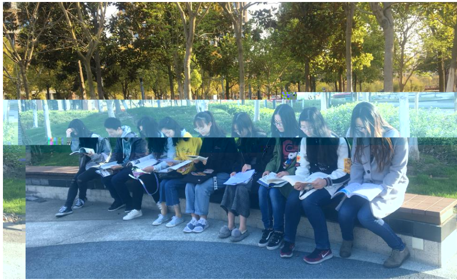
p q r s t u v w x y z