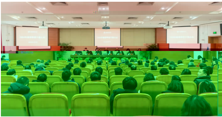
图为干部大会现场 孙庆华 /

贯,全力推动高水平应用创新型大学建设。新 今年重,党建、郭庆松,要高政 工作,全高,高 党建 创新高 重要。要 干、干、要 推动学校 上新水平。政 力、政 责, 精神,小 大 动 作。要 干,建、出、 党建,推进党建。(下转第 4 版)