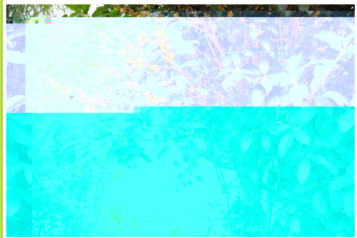
八月桂花香 / 摄

高 Z · : 便 向 们 高 ) 动 步<动 Z q 着同 ; . 景 复 }实高 u 天 觉 y要u 来 < 两} $有%&漂5 景X 着 们 > xy x .是x B景 mm 高 . 自 op 们XS 浓浓 们 天 # 队 " 着队 QQ变 .O美J Q# <O 却还是 6y l u 2 , 两} ) a: 便 人, - $ , 有人Q 4 还有 r夫 o人 $ d L , 着 人 Z Z j Z j X 白X , 白白 O有 , , 着UG 越 WZ t m !, < aM ) ! )! SEO有 " L WZ G# 有 还 l - X着 高 来 $ % & 尾' 儿.消( L ) 有 <头 )l " 景8 ' ** * X " )E l月 + " l! ", v 有 漫 着 * 自 x 们 B景 < <ZaM T E美! 是 是高 - . / B景 让 + x 有 S& c <头来 c 们 O