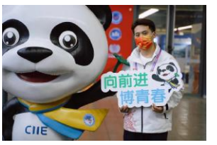
6789: ; < = > @ABC DEFG 2020